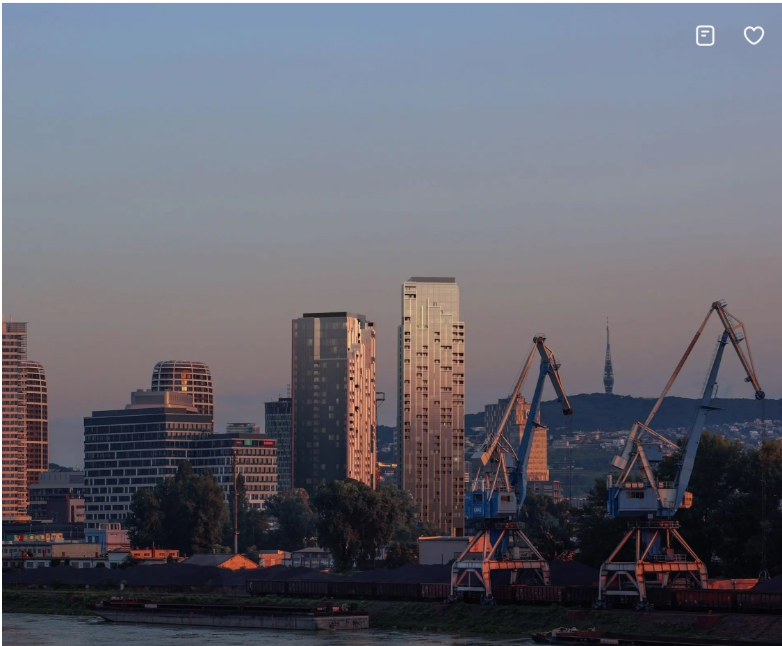
PORTUM Towers