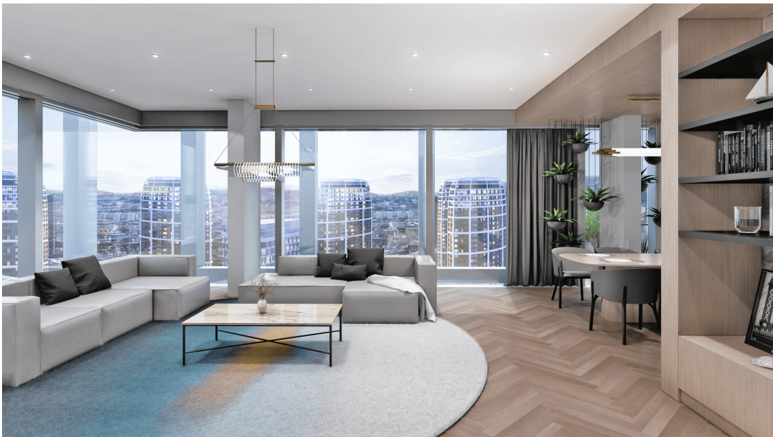
PORTUM Towers

V rámci PORTUM Towers by mal byť, ako bolo spomínané vyššie, poskytovaný zvýšený komfort. Obyvatelia budú môcť využívať wellness a fitness centrum s yoga priestorom, „meeting room“ pre pracovné či osobné stretnutia, detskú hraciu zónu a plánované sú nepretržité služby recepcie. Príjemné zážitky by mal rovnako priniesť park vo vnútrobloku.