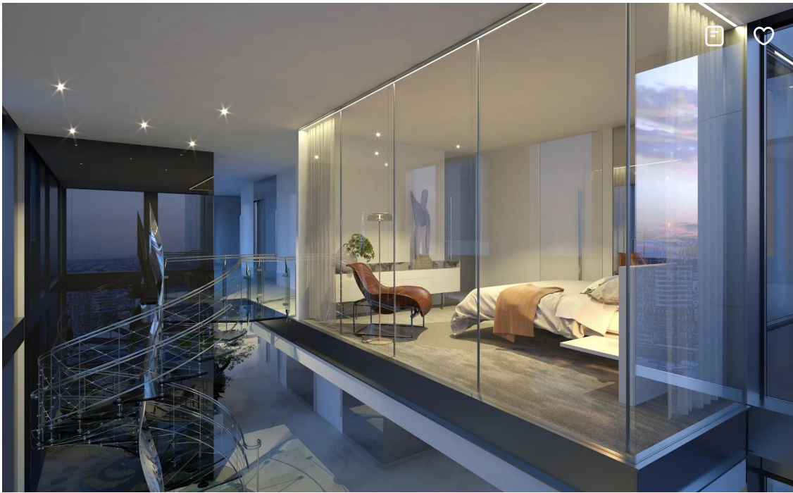
PORTUM Towers; Zdroj: portumtowers.com