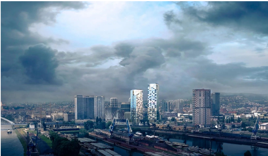
PORTUM Towers

Najcharakteristickejšími súčasťami navrhovanej kompozície novostavieb budú dva vežové objekty s plánovanou výškou 99 a 117 metrov. V pretvárajúcom sa susedstve vyniknú vďaka hmotovému riešeniu, ktoré prináša do miestnych podmienok neobvyklú štíhlosť. Zamýšľaný dojem ďalej podporí stvárnenie fasád využívajúce výrazové prostriedky zdôrazňujúce vertikality, najvyššie poschodia sa akoby postupne vynárali zo základného vonkajšieho plášťa.