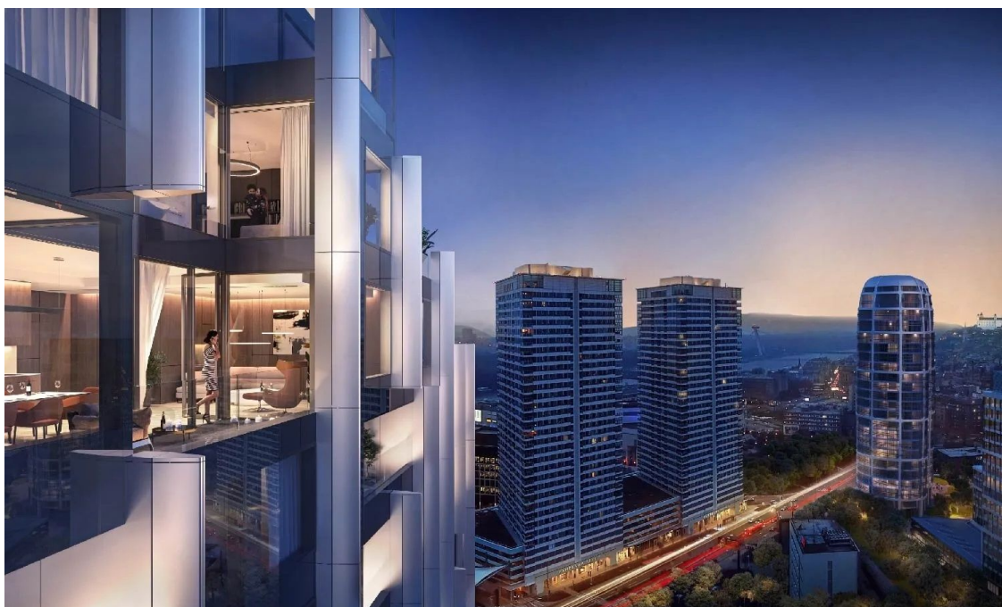
PORTUM Towers

Ponúkaná zostava obsahuje dvoj- a štvorizbové jednotky s bežnými dispozíciami vybavenými chladením obytných miestností, štýlovými vykurovacími telesami a podokennými podlahovými konvektormi, koncovými prvkami elektrickej sústavy značky Legrand a Bticino s prípravou na inteligentnú domácnosť dovoľujúcimi rozšírenie na oblasti osvetlenia, tienenia, kúrenia a chladenia. Na povrchové vrstvy budú použité drevené podlahy a veľkoformátové dlažby a obklady, osadí sa sanita a batérie značiek Villeroy&Boch a Hansgrohe.