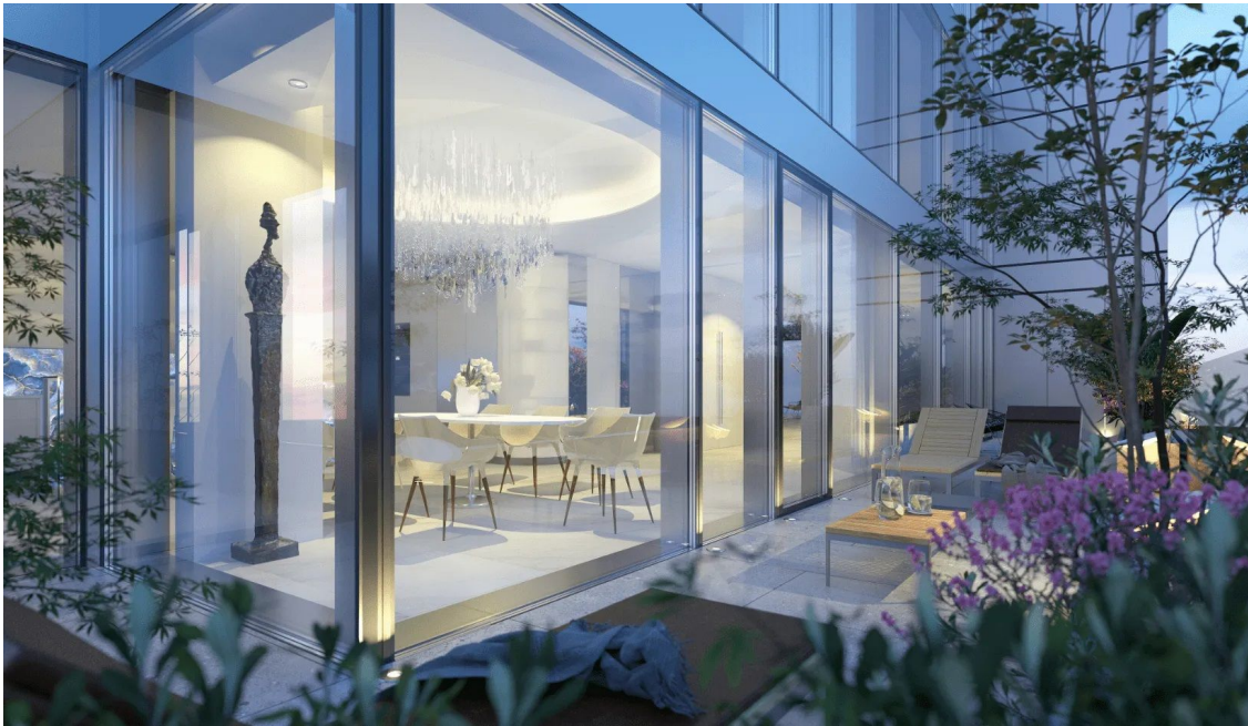
PORTUM Towers