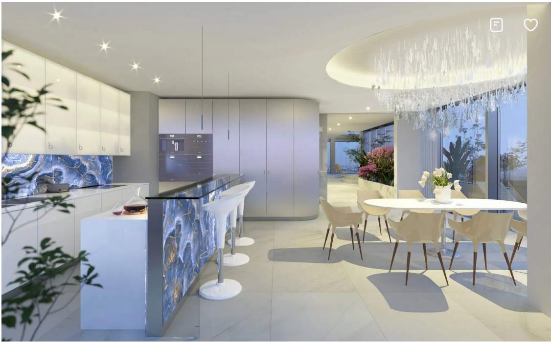
PORTUM Towers