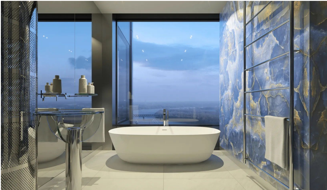
PORTUM Towers; Zdroj: portumtowers.com