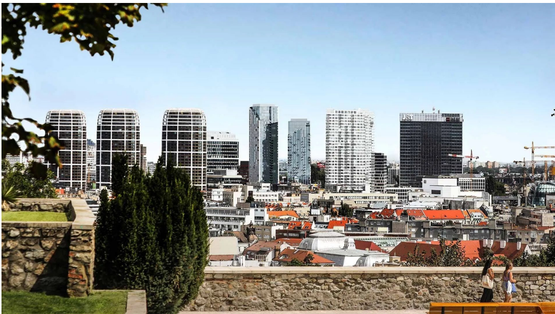
PORTUM Towers