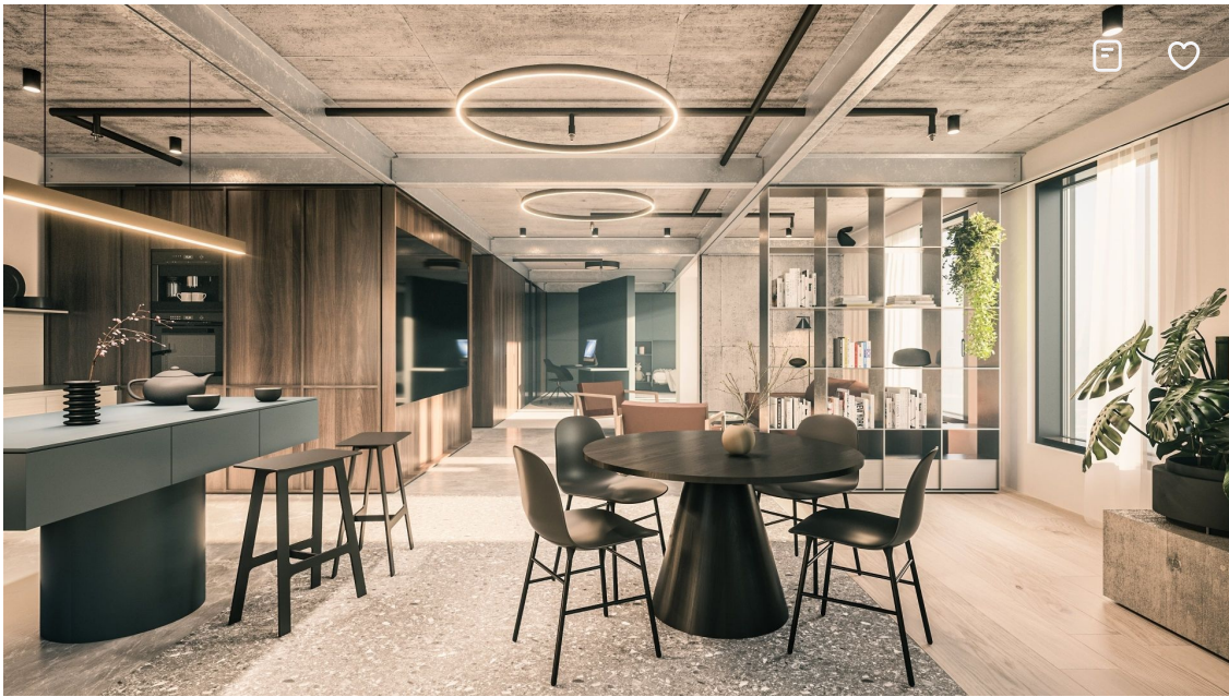
PORTUM Towers; Zdroj: portumtowers.com