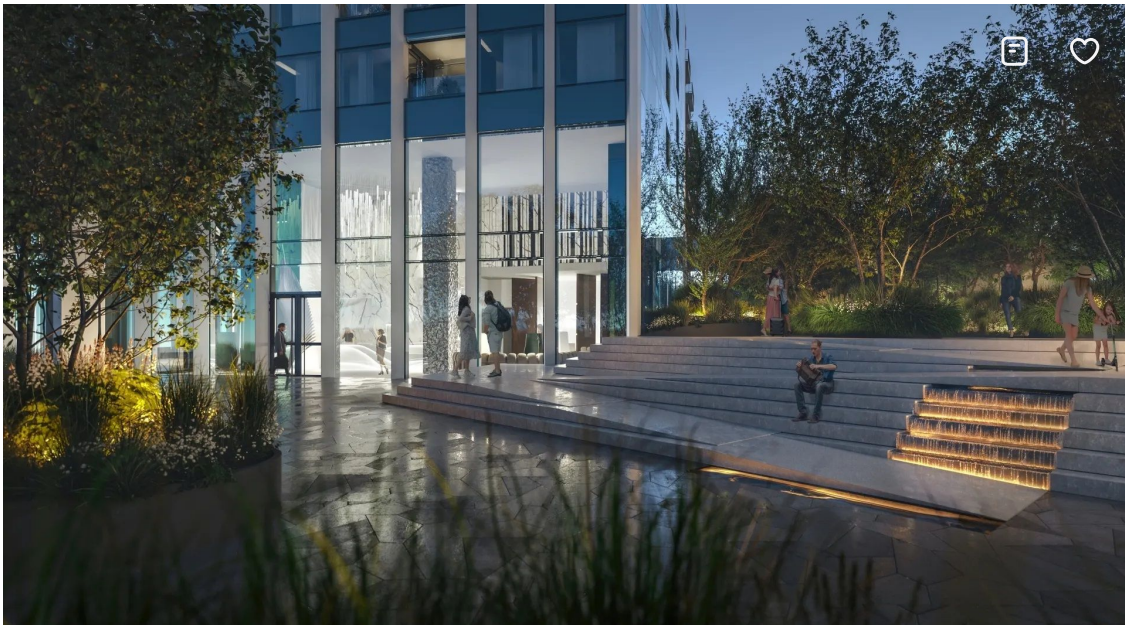
PORTUM Towers

Vyššiu úroveň by podľa dostupných vizualizácií mali získať aj spoločné priestory. Za dizajnom veľkolepých lobby výškových budov stojí známa česká architektka Eva Jiříčná s jej ateliérom AI Design , wellness je dielom Mimolimit . Oba ateliéry zároveň pracovali na interiéroch niekoľkých prémiových bytov, pričom okrem nich sa na podobe ďalších bytových jednotiek podieľali i iní zaujímaví aktéri z Chybik + Kristof Associated Architects , ADR , Forms.Architects a Machar and Teichman Architects .