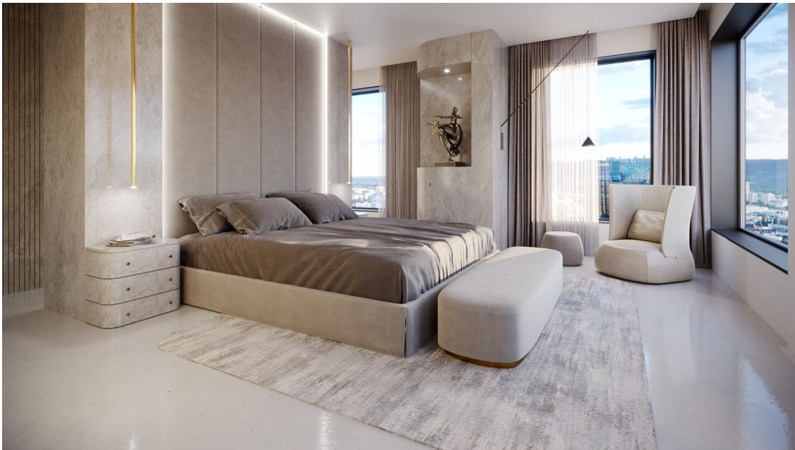
PORTUM Towers