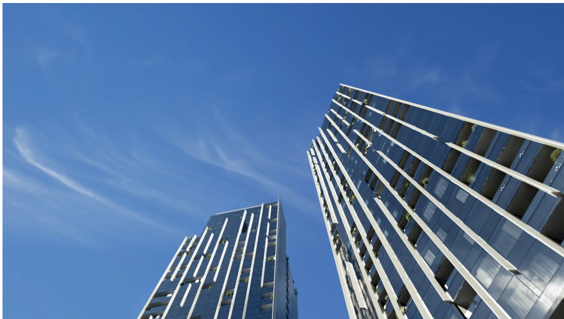
PORTUM Towers; Zdroj: portumtowers.com

Exkluzivita má byť demonštrovaná ponúkaným pohodlím a tiež dizajnovým spracovaním celku. Exteriér bude dopovedaný komplexným návrhom vnútrobloku s parkom, ktorý vytvorili autori z oceňovaného ateliéru Flera založeného záhradným architektom Ferdinandom Lefflerom .