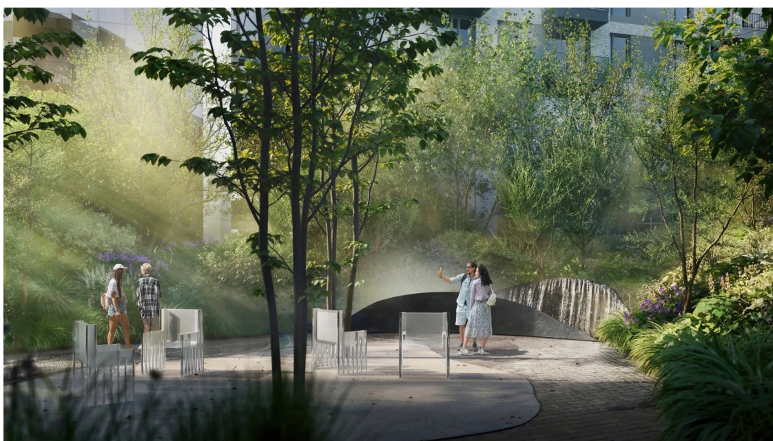
PORTUM Towers